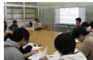
【ミーティングルームでの授業風景】

ミーティングルームを利用する際は責任者(教員)と一緒に利用してください。 利用する場合は、責任者(教員)が直接図書館へ申し込んでください。